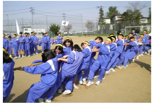
【力を振り絞る黄軍】

また、今年は軍対抗綱引きを行い、体育祭のトーナメントの組み合わせを決めました。結果は以下のとおりです。